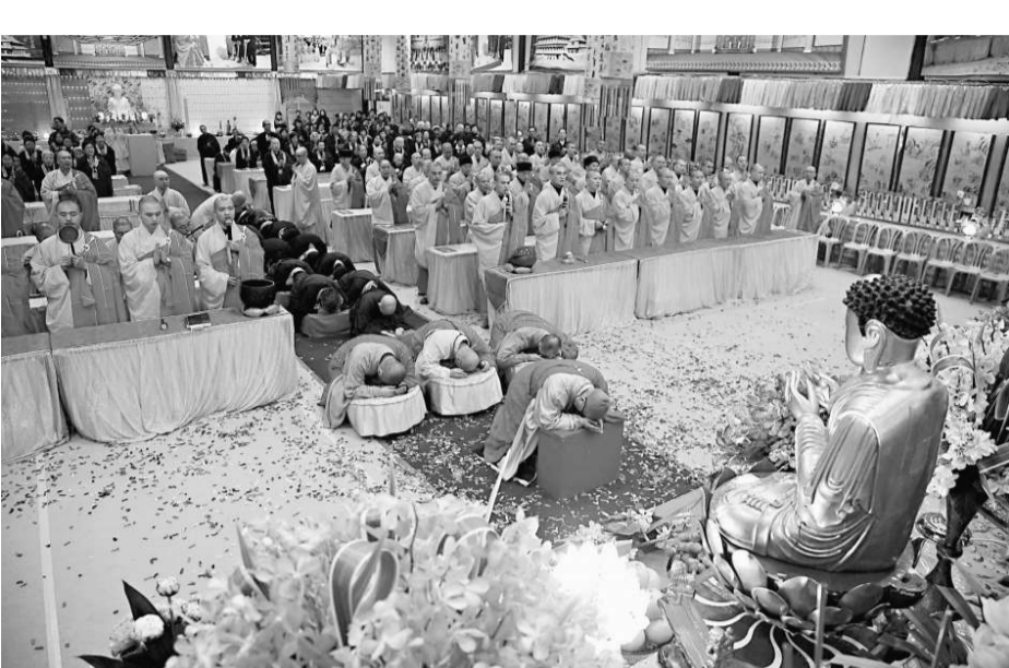
寶蓮禪寺的僧人為水陸法會進行灑淨儀式