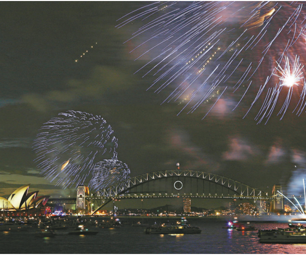
澳洲悉尼舉行煙花匯演，喜迎新年