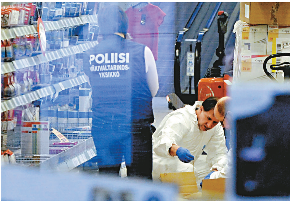
▲ 芬蘭警察在槍擊案事發現場檢查

【本報訊】據法新社赫爾辛基三十一日消息：一名穿黑衣服的獨行槍手星期四在芬蘭第二大城市埃斯波一家購物中心開槍打死五人後自殺。