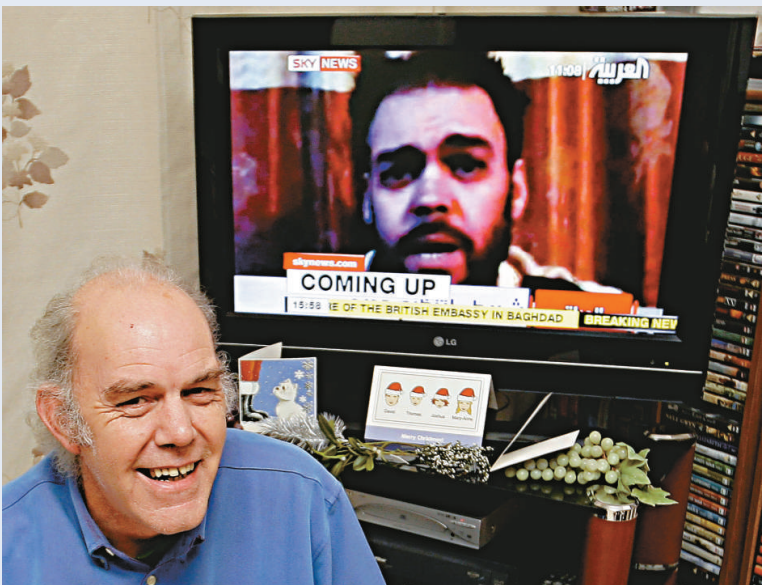
穆爾的父親三十日坐在電視前，觀看兒子被釋放的新聞