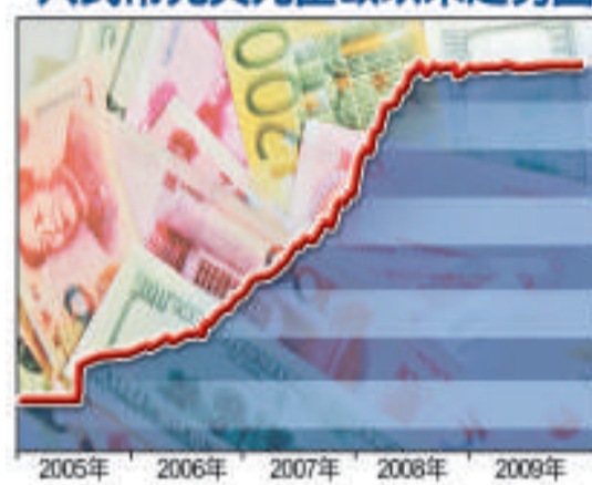
人民幣兌美元匯改以來走勢圖

人民幣兌美元去年接近停止升值，廣東發展銀行資本金部最新研究報告料人民幣兌美元即期匯率一〇年上半年將維持現狀，下半年人民幣匯率或會出現微調可能，但即使人民幣升值，預期其幅度也少於500點，不大可能重現〇七至〇八年的快速升值態勢。報告又預計，中國一〇年加息將出現在下半年，最多僅加息一至兩次。