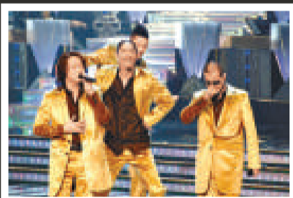
▲「EXILE」獲獎後於台上獻唱