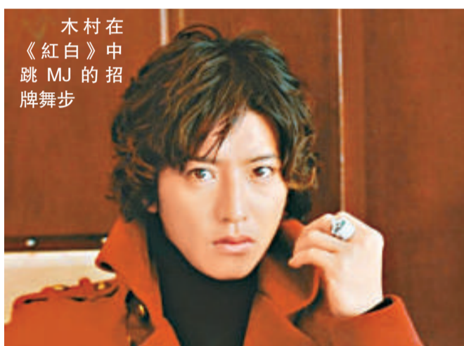
木村在《紅白》中跳 MJ 的招牌舞步

《紅白歌唱大賽》於昨晚舉行，「SMAP」於悼念米高積遜 (Michael Jackson) 的環節中表演。