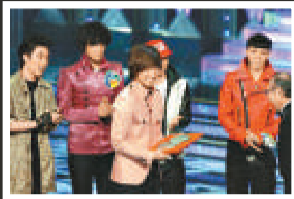
▲韓國組合「Big Bang」得新人獎，遭網民質疑