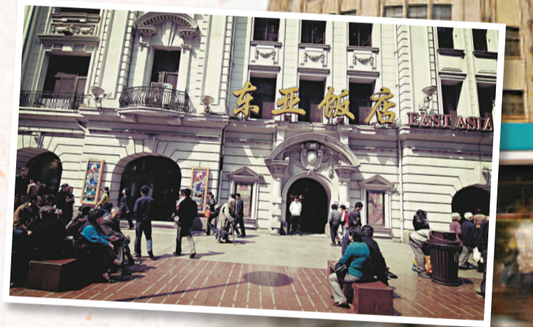
▼上海著名老飯店東亞飯店前身是上海先施公司的一部分，至今已有八十餘年的歷史