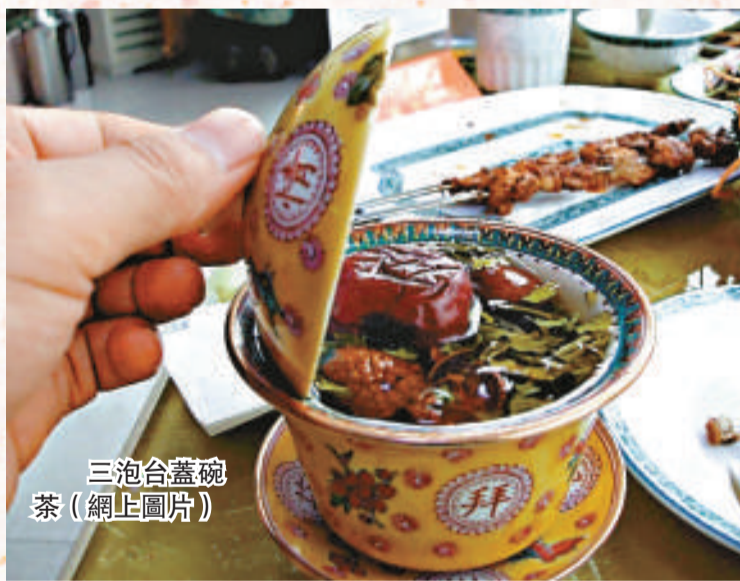
三泡台蓋碗茶（網上圖片）