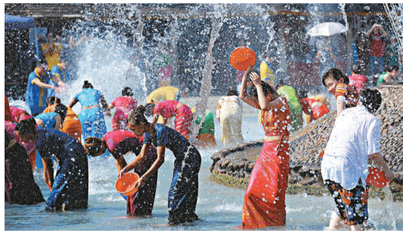
▲傣族群眾在景洪市傣族園景區潑水狂歡

在雲南省西雙版納傣族自治州景洪市橄欖壩的傣族園，遊客可以領略傣族文化，感受傣族潑水節，觀賞傣族織錦、慢輪製陶、傣首飾加工、榨糖等民族手工藝製作活動。鮮為人知的是，村民們住傣樓、穿傣裝、過傣節，製作傣族傳統工藝品，都可以領取補助。