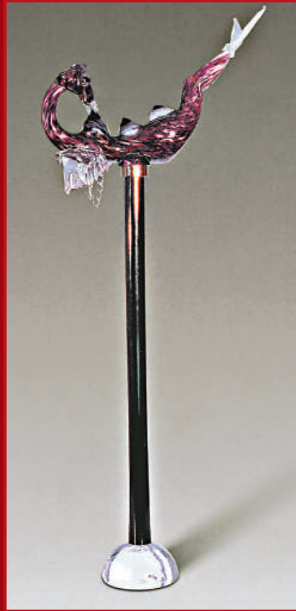
孫良（1957） 吮 2006年 玻璃 雕塑