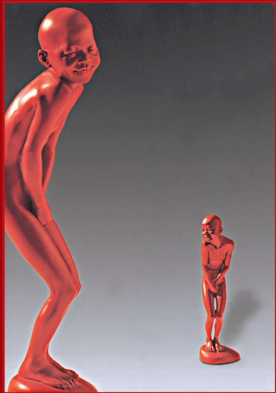
陳文令（1969） 紅色記憶——羞 2003年 玻璃鋼 雕塑