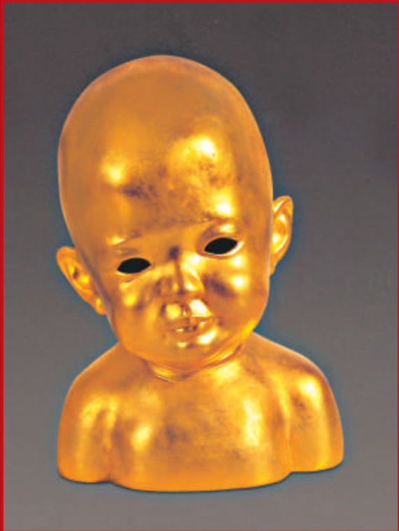
姜杰（1965） 在 2001年

如果說兒童是目前為止姜杰作品中最重要的主題，易碎就是它們共同的特徵。姜杰以她女性獨有的細膩和敏銳，用一種視覺化的手段，訴說着生命本質上的脆弱，以及生存過程中無處不在的危機感。與此同時，這些柔弱的娃娃，又往往帶有工業製品似的光滑、閃亮和矯飾的非自然的工業色彩，彷彿機械複製的人形空殼，惹人憐惜，卻冰冷、物化、毫無個性，這似乎又是對商業社會精神向度空心化的某種諷喻。正如其直接卻又一言難盡的精神內涵那樣，姜杰作品的真正價值也在逐漸為人所認識。「幼兒身上所蘊含着的那種神秘、脆弱、柔軟、濕潤、敏感與淒涼，我從未在一個成年人身上看到過。」