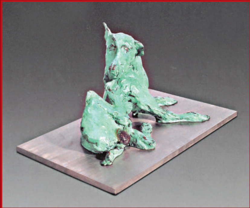
周春芽（1955） 撓癢的黑根 2005年 銅着色 雕塑