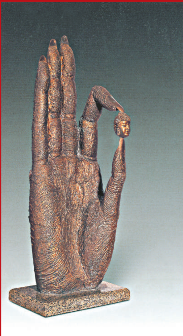
朱成（1946）天際 1997年 青銅 雕塑