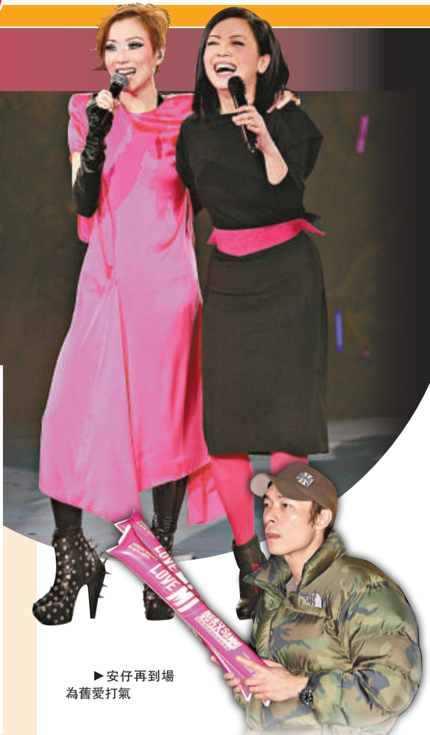
Sammi 和雯女演繹單身女人的美麗