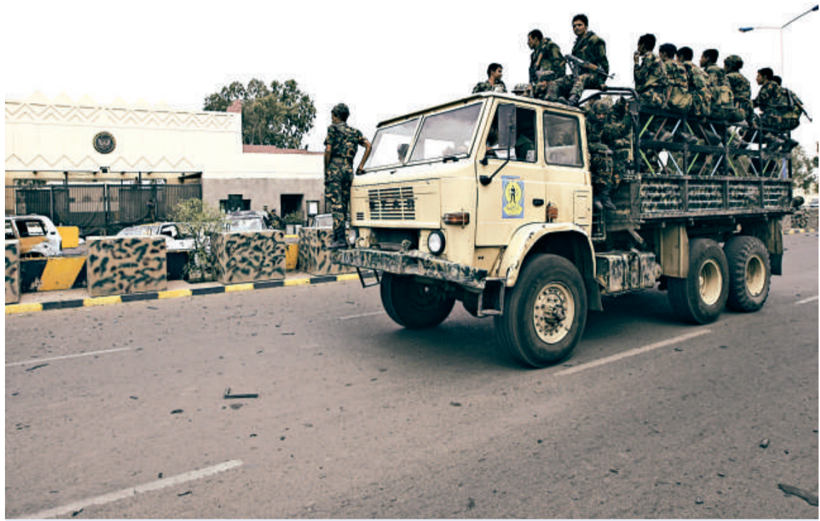
二〇〇八年九月十八日，也門士兵駐守在美國大使館門前

在二〇〇八年九月十七日，美國駐也門大使館遭到「基地」組織的襲擊，造成十九人喪生，除七名襲擊者外，其餘十二名死者中有也門警衛和平民，還有一名美國女性。