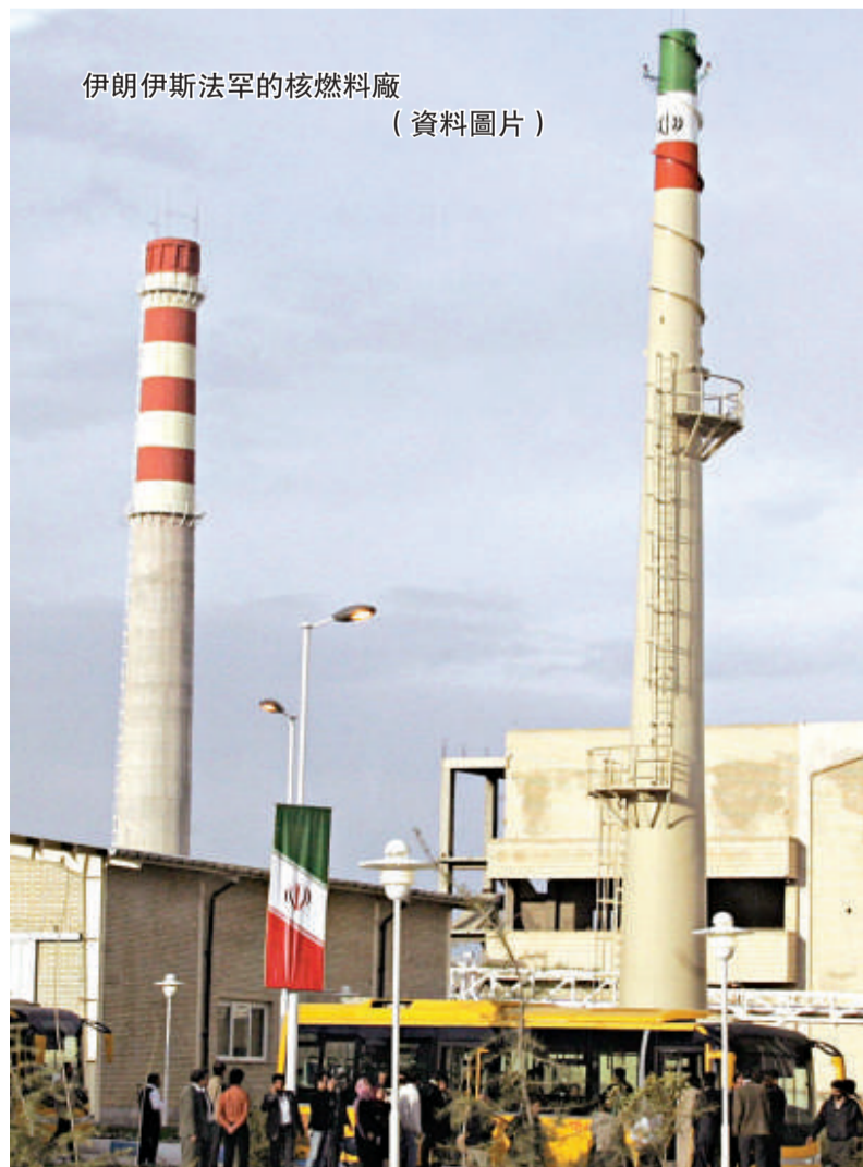
伊朗伊斯法罕的核燃料廠 (資料圖片)

人體掃描器通常使用X光影像技術或毫米波技術對乘客進行掃描。安檢人員可「看穿」乘客身上的衣服，但連私處也一清二楚。事實上，人體掃描器已被引進歐美多年，各國一直因隱私問題，未對一般乘客強制實施。在英國更要豁免對兒童使用。