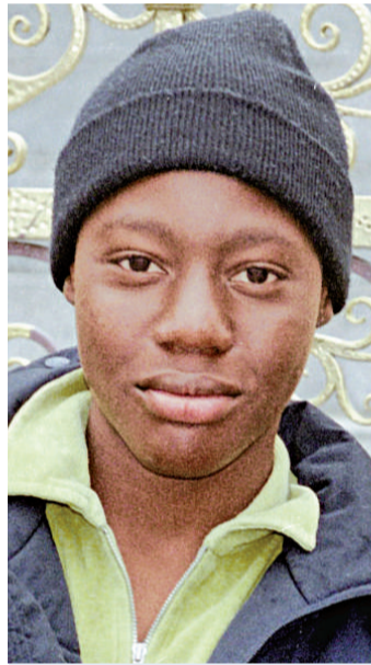
企圖在去年聖誕節炸毀美國客機的尼日利亞籍嫌犯阿卜杜勒·穆塔拉布 (資料圖片)

穆塔拉布炸機未遂事件曝光後，英國軍情五處緊急將他二〇〇五年至二〇〇八年在英國境內活動的情況報告給美國情報機構。調查人員推測穆塔拉布曾試圖從英國實施這起恐怖襲擊，但卻由於他的學生簽證申請在今年初遭到拒絕而未能如願。在此之前，穆塔拉布曾持學生簽證在英國生活了三年時間。英國白廳官員已經表達了他們的擔憂，那就是極端分子們正在利用英國監管相對寬鬆的漏洞。穆塔拉布接受「基地」組織訓練一年多後，還曾在白金漢宮的外面拍攝了照片。英國的調查人員目前正在追蹤穆塔拉布當初在英國的生活軌跡，他們懷疑穆塔拉布並非是一個人策劃發動恐怖襲擊。英國軍情五處和警方反恐部門日前已經加派了警力，試圖在英國內搜捕那些與穆塔拉布有聯繫的激進分子。