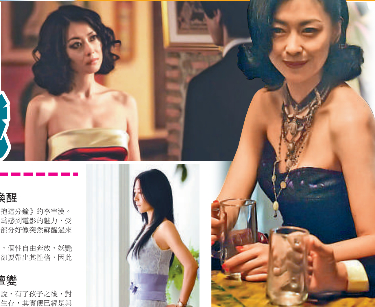
▲中山美穗闊別十二年復出，其新片令人期待 ▲中山美穗希望把息影以來的經歷放入角色中