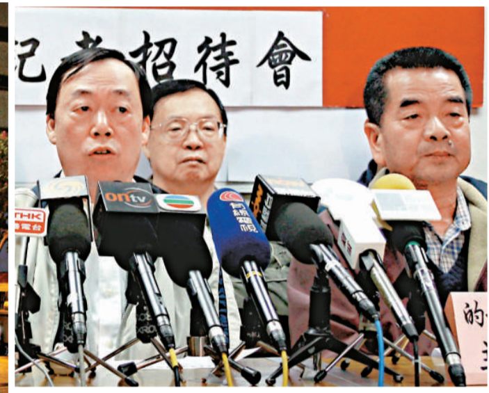
▲的士業工會昨舉行記者會，要求機電工程署加強監管車用石油氣

機電工程署昨晚表示，將就近日發生的士和小巴死火問題，成立專案小組，展開全面和深入調查，研究事件的成因。署方發言人表示，為加強在這段期間車輛燃料系統的維修，署方將為維修業界提供應急指引；並安排約二十部石油氣車輛，在進行妥善的燃料系統維修之後，持續監察產生積聚物的情況。