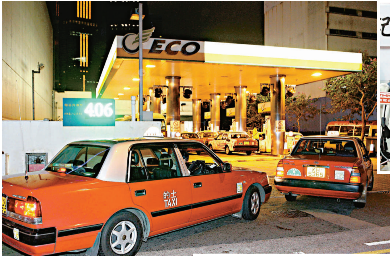
▲很多的士及小巴昨天都轉往中石化以外的油站加氣，令這些加油站大排長龍