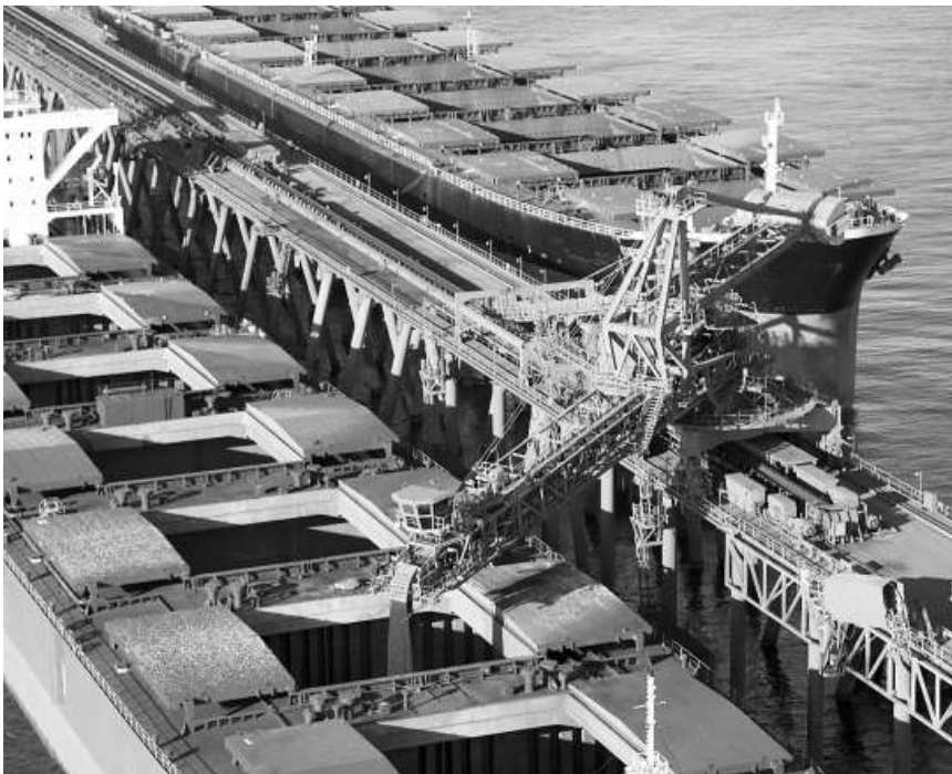
中國船東成為去年二手乾散貨船最大買家，購船量較08年激增一倍多

【本報訊】希臘老牌船舶經紀公司 Allied Shipbroking 日前發表最新報告，總結2009年全球二手船買賣市場表現，中國期內購置二手乾散貨船數量和成交金額已超越希臘，冠絕全球。而綜合所有船型數據，希臘船東購入二手船的總成交金額穩佔第一，中國船東排名第二，兩國船東合計佔去全球二手船交易市場成交金額約四成，反映在環球經濟危機的影響下，二手船購買力更集中在個別船東身上。