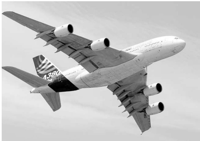
空巴四次下調A380交付量目標，但仍不能達標

空巴母公司歐洲航空防務和航天公司行政總裁加洛爾斯上月初表示，在09年交付的A380，成本仍然太高。該公司至今已經花費至少260億美元開發A380，比原來估計多出50%，並且正在竭力滿足包括淋浴房、包廂等個別需求。