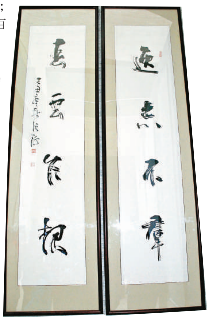
全國人大常委會副委員長韓啟德作品 中國書協主席張海作