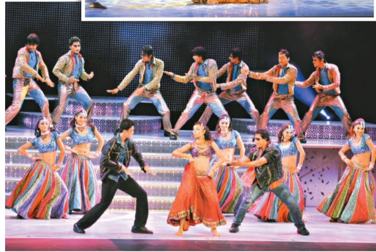
印度傳統服飾與西方皮革及牛仔服在劇中互相對比