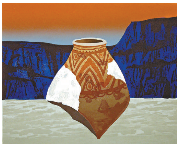
▲姜陸絲網版畫作品《初熹》