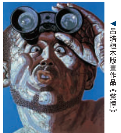
▲呂培恒木版畫作品《驚悸》