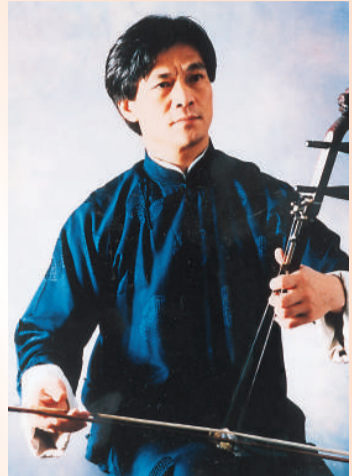
香港青年中樂團本月中在臺灣大會堂獻藝 著名胡琴演奏家黃安源

【本報訊】矗立於群山之巔的萬里長城延綿千里，象徵着中華民族堅毅不屈的精神。香港青年中樂團與前香港中樂團團長、著名胡琴演奏家黃安源於月中舉行的周年音樂會，攜手演繹澎湃激昂的二胡協奏曲《長城隨想》，還有多首細緻動人的中國樂曲，引領觀眾穿梭氣勢磅礴的長城及充滿生機的漁鄉田間，細味神州大地的音樂色彩。