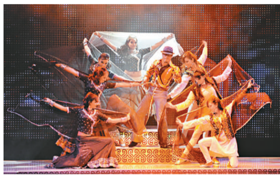
《舞動寶萊塢》歌舞連場

《舞動寶萊塢》音樂劇的女主角是年輕的Ayesha，她出身舞蹈世家，矢志追求夢想，為了嚮往寶萊塢