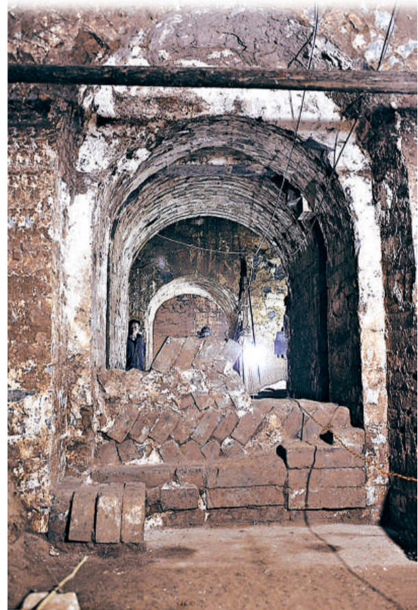
這是考古發現的「曹操高陵」前室拱門

另據湖北省文物局透露，該省第三次全國文物普查11個地市實地調查工作日前全部完成，全省原有文物遺存14191處，通過普查新發現20090處，除去部分消失文物，全省不可移動文物總量超過33000處。