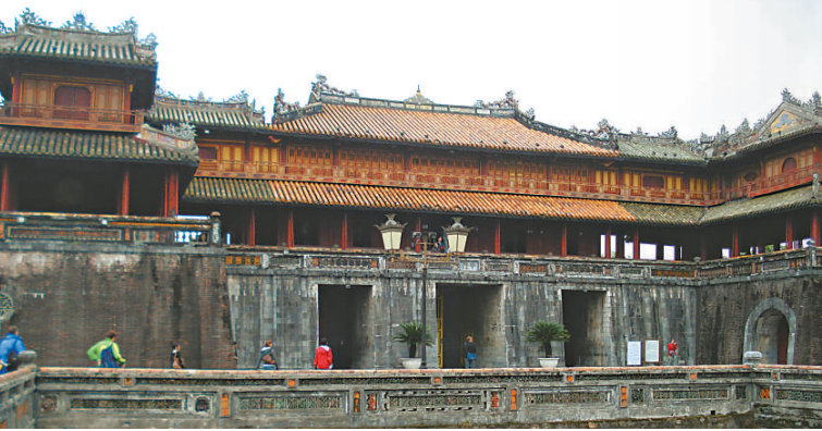
越南順化阮朝紫禁城

越南屬漢字文化圈國家，古時受中國文化的影響至鉅且大，國內古蹟處處皆見漢字，建築風格與中國同中見異，既見中國文化的蹤影，也有自身的特色，散發異國風情。