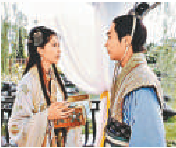
港產電視劇《洛神》劇照

恍如連環圖的《洛神賦圖》，主要可分為三部分，精準地展現原文內容。卷首描繪曹植在侍從簇擁下來到洛水邊，遙望河上現身的洛神。在顧愷之如「春雲浮空，流水行地」的筆觸下，梳着高髻、衣帶飄逸的洛神依依回望欲去還留，形態優美動人。洛神四周還點綴了盛開的荷花、游龍鴻雁，增添神話的夢幻色彩。中段描繪