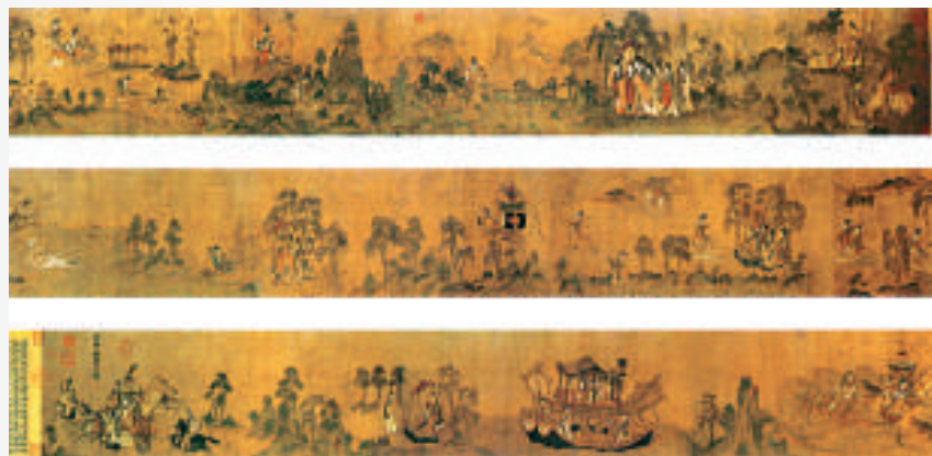
顧愷之的《洛神賦圖》，展現曹植夢會洛神一段如夢似幻的依依離情