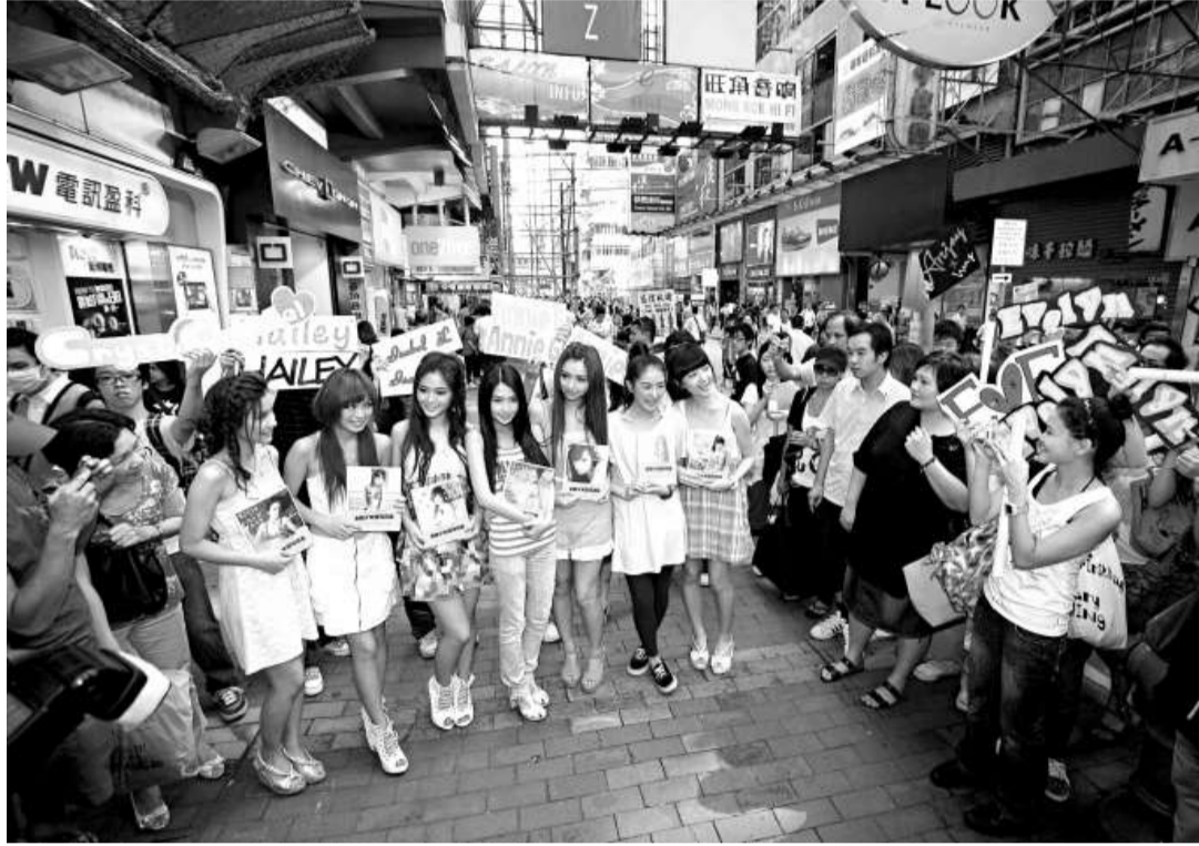
本港近年興起嘍模熱潮，但行內競爭激烈，要想突圍成名絕非容易（資料圖片）