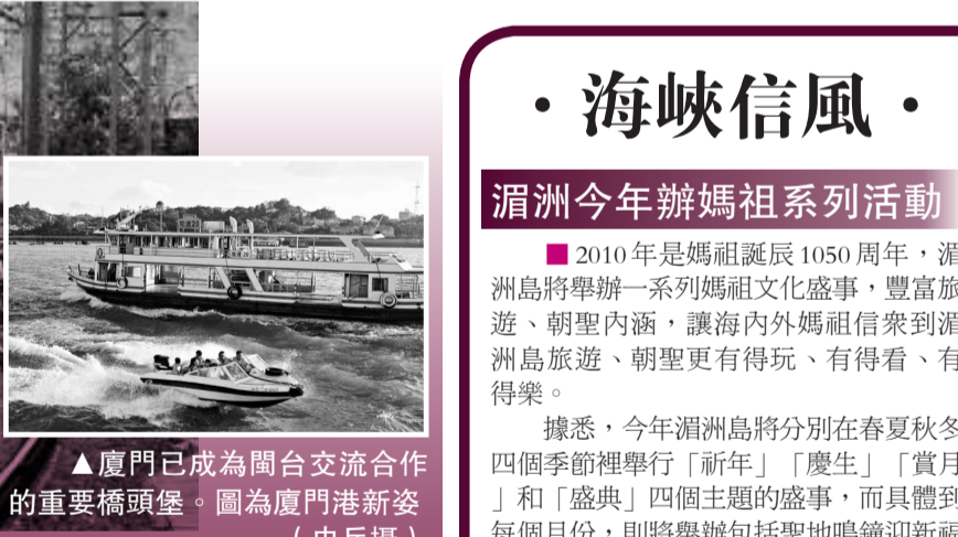
▲廈門已成爲閩台交流合作的重要橋頭堡。圖爲廈門港新姿

二〇〇九年的最後一天，溫福、福廈等三條鐵路開通及合福、贛龍等六線一站開建儀式在閩省九個設區市同時舉行。作為未來海峽鐵路網的重要組成部分，這些項目的快速密集開建，無不顯示福建省在未來海峽兩岸直接往來中將扮演重要的樞紐角色。新年伊始，福建省交通運輸廳對外表示，福建今年將加快構建兩岸直接往來綜合通道，推動閩台經貿合作和兩岸「三通」新發展，為兩岸民眾共謀福祉。