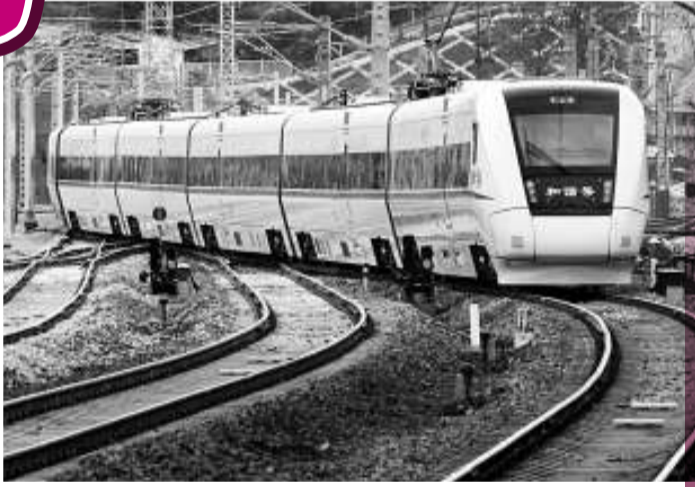
▲溫福高鐵客運已正式開通。圖為溫福鐵路首趟「和諧」號客車開出車站