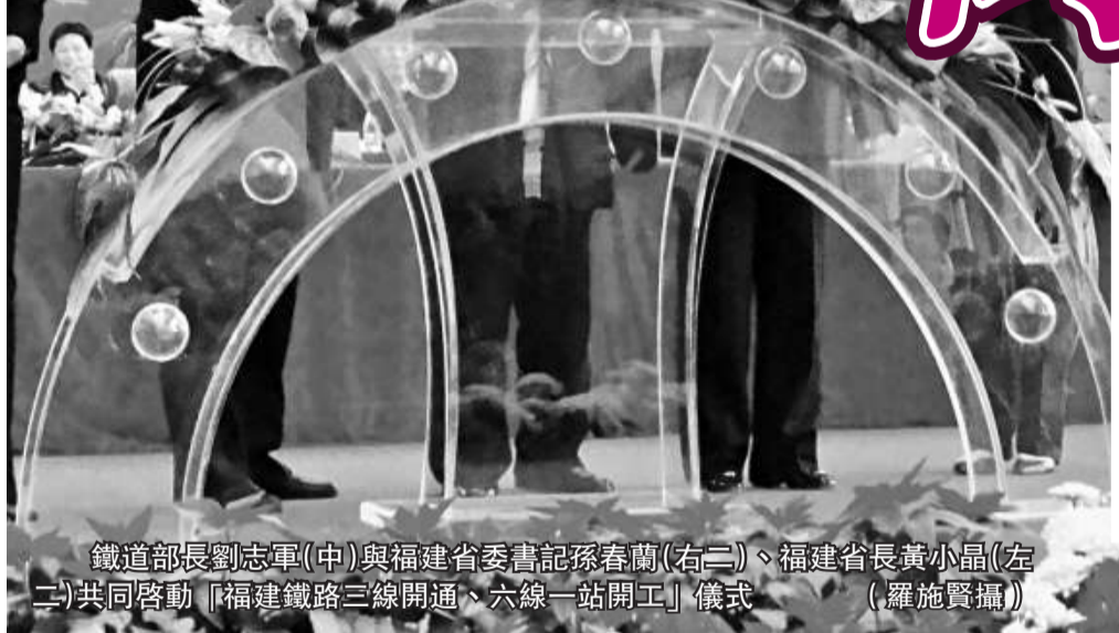
鐵道部長劉志軍(中)與福建省委書記孫春蘭(右二)、福建省長黃小晶(左二)共同啓動「福建鐵路三線開通、六線一站開工」儀式