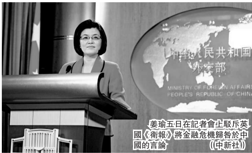
姜瑜五日在記者會上駁斥英國《衛報》將金融危機歸咎於中國的言論