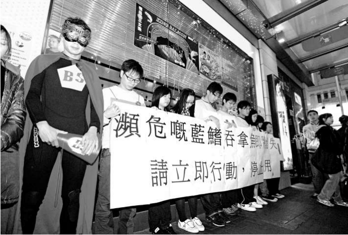
▲世界自然基金的代表昨晚到板長壽司在灣仔的分店外，抗議該店所屬集團競投藍鰭吞拿魚

事實上，近年亦有不少企業加入停止出售藍鰭吞拿魚的行動，當中不乏大型企業，如最新加入的四季酒店、置地文華東方酒店和諾富特東薈城酒店等；而馬哥孛羅香港酒店、維景酒店、九龍維景酒店、九龍麗東酒店、利景酒店、Pret A Manger及薈宴等酒店食肆早年亦已停止出售該類藍鰭吞拿魚。