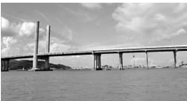
橫琴新區將在橫琴大橋規劃開建一座高架橋駁通港珠澳大橋，陸路直通香港

【本報記者方俊明珠海五日電】「橫琴新區」管委會今天起懸賞十萬元（人民幣，下同），面向全球公開徵集新區形象標誌，以塑造橫琴獨特的品牌形象，全方位打造「一國兩制」下的粵港澳合作新模式示範區。同時，作為新區「重頭戲」項目的十字門商務區城市設計概念方案出