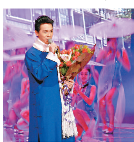
▲東山少爺演唱《西關小姐》

■本報記者袁秀賢廣州報導：「唱響廣東」二〇〇九廣東旅遊金曲精英大賽的金曲揭曉頒獎晚會，日前在廣州舉行，《西關小姐》等二十首旅遊金曲誕生，並由內地明星傾情演唱十佳金曲。廣州、深圳、佛山、中山、梅州等地分別獲獎。