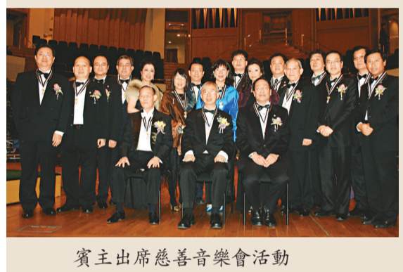
賓主出席慈善音樂會活動