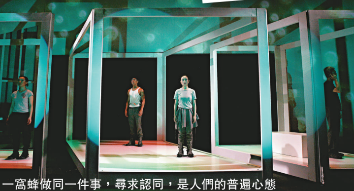
一高峰做同一件事，尋求認同，是人們的普遍心態