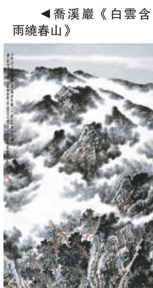
▲喬溪巖《白雲合兩繞春山》