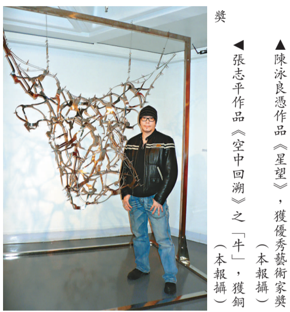
▲陳泳良憑作品《星望》，獲優秀藝術家獎 ▲張志平作品《空中回溯》之「牛」，獲銅獎 (本報攝)