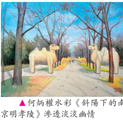
▲何炳權水彩《斜陽下的南京明孝陵》透逸淡淡幽情

「畫家之旅畫展」由香港畫家之旅畫會主辦，即日起至一月七日在香港文化中心地下大堂舉行，查詢可電二五〇五八三三五。