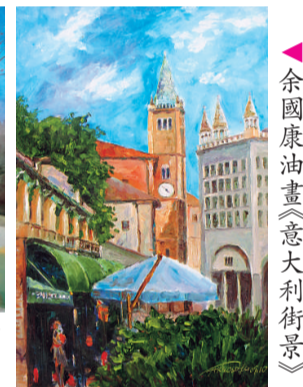
▲余國康油畫《意大利街景》