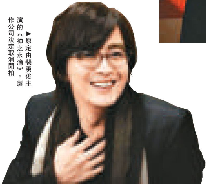
▶原定由裴勇俊主演的《神之水滴》，製作公司決定取消開拍