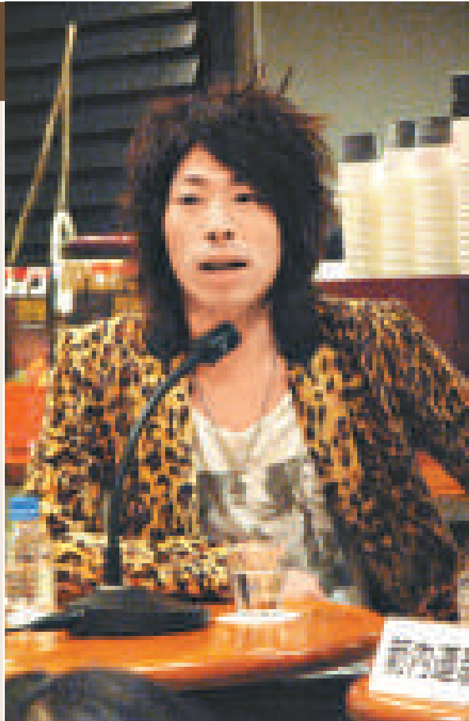
▲田村淳除了以刻薄聞名之外，其風流帳也是不斷 ▲安室奈美惠（右）和田村淳在鳳凰城時放下戒心，公然手拖手