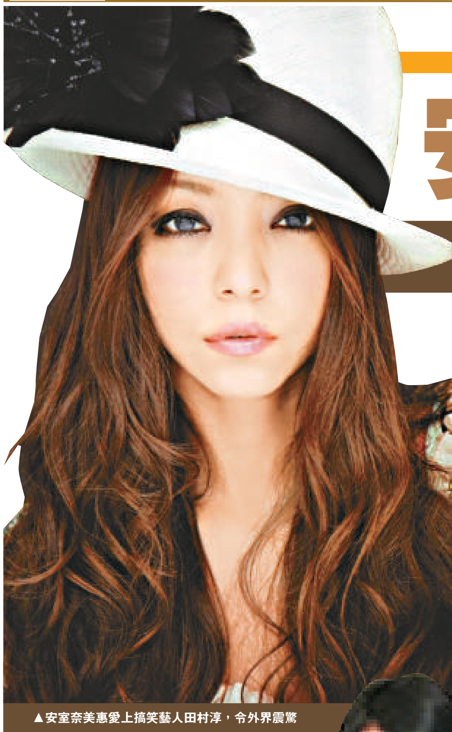
▲安室奈美惠愛上搞笑藝人田村淳，令外界震驚