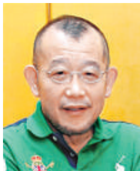
▲笑福亭鶴瓶首次主演電影，即獲藍絲帶的最佳男主角提名

由東京電影記者會主辦的第五十二屆藍絲帶獎，於日前公布各部門候選名單。今年一共有四十一部日本國內外的電影獲提名，其中由笑福亭鶴瓶主演的電影《Dear Doctor》和淺野忠信的《劍岳點之記》，均獲得最佳電影、導演和男演員等五項提名，為最多提名的兩部作品；其他如《援膠女郎》、《維榮之妻》和《零的焦點》亦有三項提名，松隆子和廣末涼子等會爭奪最佳女主角的榮譽。