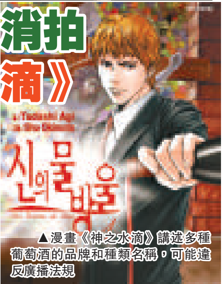
▲漫畫《神之水滴》講述多種葡萄酒的品牌和種類名稱，可能違反廣播法規

韓流天王裴勇俊原本預定主演以紅酒為題材的新劇《神之水滴》，但近日製作公司傳出取消拍攝的消息，原因是原著漫畫中出現不少葡萄酒的品牌和種類名稱，在拍攝時可能未能與韓國的廣播法規契合。為免拍攝時要故意還就而令劇集喪失原有興味，製作公司決定不再就漫畫的版權合約續約。