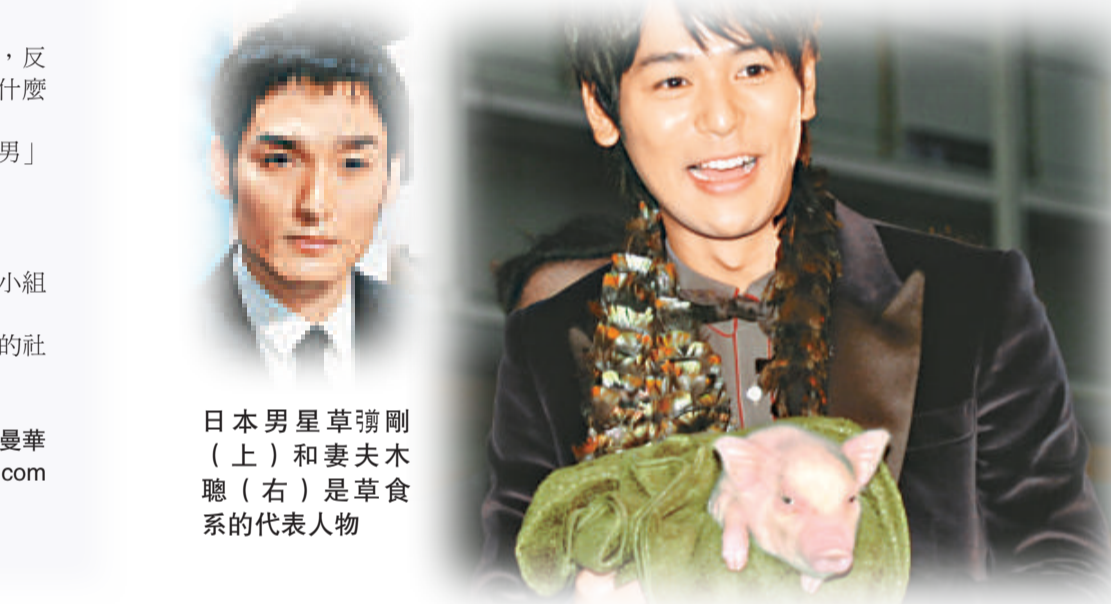
日本男星草瀨剛(上)和妻夫木聰(右)是草食系的代表人物