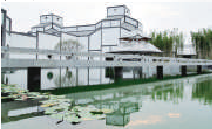
貝聿銘設計的蘇州博物館新館