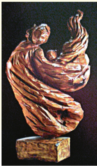
▲海島情系列——向上（材料：台灣蕭楠）