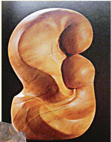
▲生命潮系列——初戀（材料：台灣紅檜）