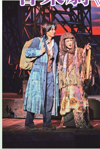
▲《蝶》劇裡，老酒鬼為梁山伯指明通往世界盡頭之路

【本報訊】記者于海江哈爾濱報道：由哈爾濱松雷集團出品的音樂劇《蝶》，將於九月、十月期間現身世博會及代表中國遠赴歐洲巡迴。該劇並由一月二十五日起在家鄉哈爾濱開始公演。