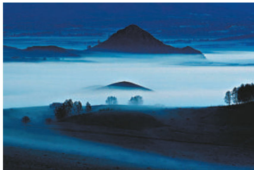
香格里拉大獎作品《小紅山的晨霧》

每個人心中都有自己的「香格里拉」，那是一片心靈的寧靜聖地。「我的香格里拉」攝影比賽讓參加者透過鏡頭捕捉「香格里拉」優雅、自然、寧靜、神秘、迷人和關愛的特色，並傳揚生態保護理念。該比賽的獲獎作品及評委佳作，分別在北京、上海、廣州、成都巡展。