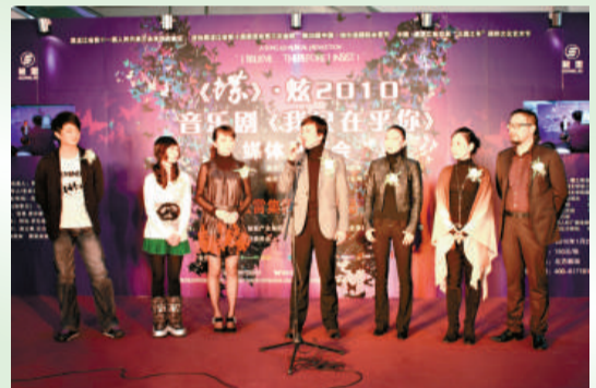
▲音樂劇《蝶》台前幕後主要人員與媒體見面

此外，《蝶》在二〇〇九年七月訪港公演，獲得好評，松雷集團預計今年將再訪港演出多場。