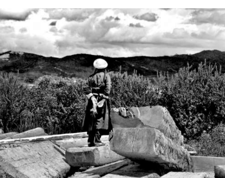
▶銀獎作品《未泯的童真》