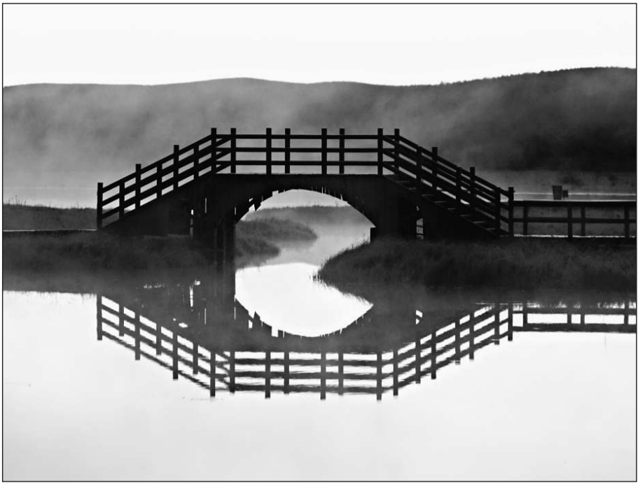
七星八卦圖