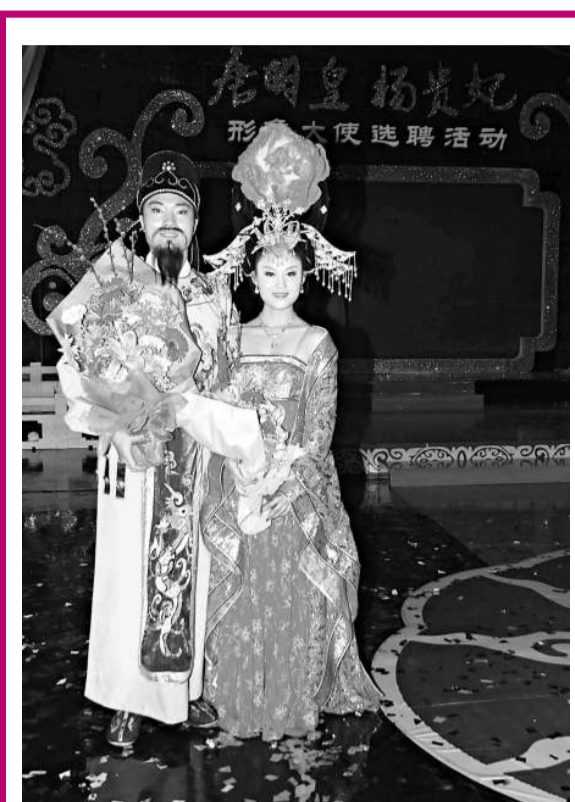
新當選的「唐明皇」和「楊貴妃」形象大使

據悉，現代的3D、4D技術的發展，也為國產經典動畫在新時代中的新生創造了條件。當前，僅上海地區製作3D的機構就有十多家。去年11月尾，上影集團與國際知名特效製作公司，曾為《集結號》、《納尼亞傳奇》、《2012》等多部大片提供技術支持的湯姆遜達成合作，上影和湯姆遜共同成立的合資公司將全面涉足影視後期製作、動畫製作、膠片3D及遊戲等相關業務。公司除了啟動「3D孫悟空」項目外，還將為上海美術電影製片廠的經典舊劇翻拍提供技術支援，3D版本的《天書奇譚》、《黑貓警長》等將陸續上映，後者的目標是打造中國動畫版的「007」。