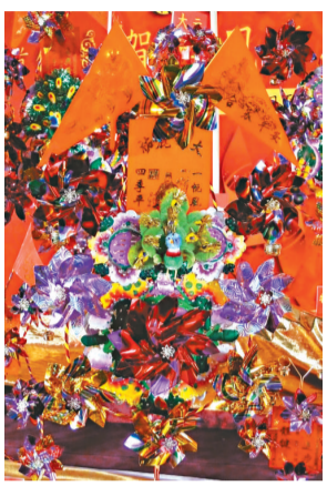
▲傳統風車「孔加大九」，即孔雀裝飾的加大碼九洞風車（本報攝）

「賀年風車工藝」珍藏展將於一月三十一日至二月二十八日在鑽石山荷里活廣場一樓明星廣場舉行，查詢可電二一八八八一。