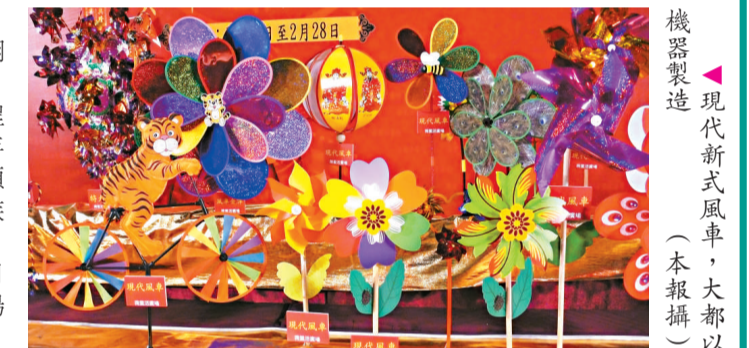
▲現代新式風車，大都以機器製造