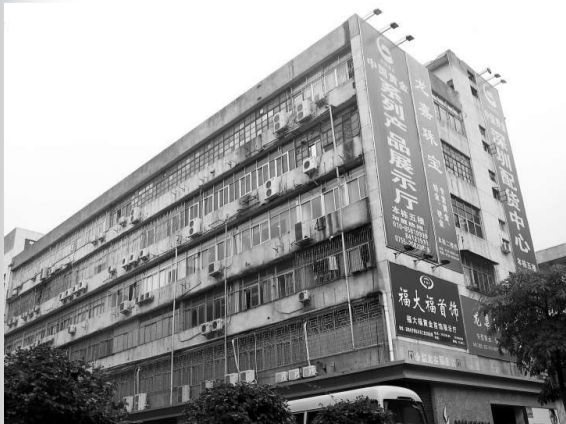
逾百間港人私人珠寶加工廠「隱身」羅湖水貝萬山工業區一帶

城門失火,殃及池魚。深圳鑽石首飾產量佔全國八成比例,一旦成批的珠寶加工廠倒閉,很可能成為壓垮內地珠寶業的一根稻草,亦將對一直依靠深圳珠寶進出口「輸血」的香港珠寶產業形成衝擊。