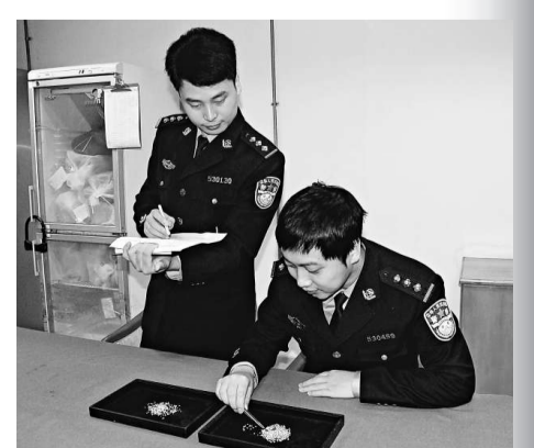
深圳緝私警察在清點查繳的走私鑽石

羅湖海關緝私分局偵查科姓杜的工作人員解釋稱,按照規定,加工貿易渠道免稅進口的珠寶鑽石原料,需要出口等量的珠寶首飾,該企業企圖用黃銅頂替黃金出口從而平衡加貿合同手冊,至此這條走私大魚終於露「餓」了。