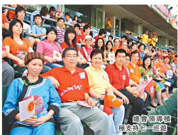
總會領導積極支持七一巡遊

三年以來，由總會舉辦的多個內地參觀考察活動，均深受各會員歡迎，對促進兩地的交流，取得了非常理想的