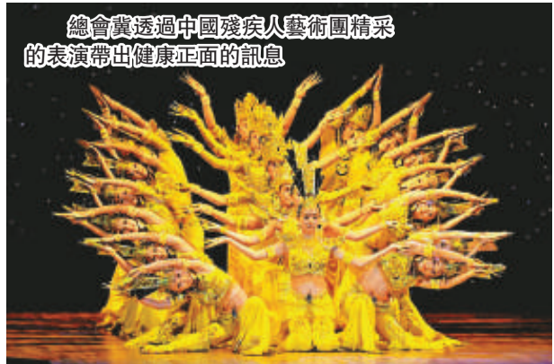
總會透過中國殘疾人藝術團精采的表演帶出健康正面的訊息