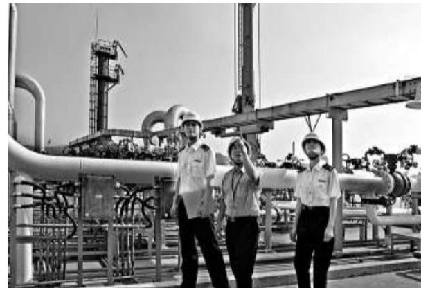
面對液化氣進口激增，廣州海關加強油氣化工品監管

【本報記者潘納新廣州十二日電】2009年經廣東口岸進口液化石油氣及其他煙類氣（以下簡稱「液化氣」）748.1萬噸，比上年同期增長50.8%；價值24.6億美元，增長10.8%。