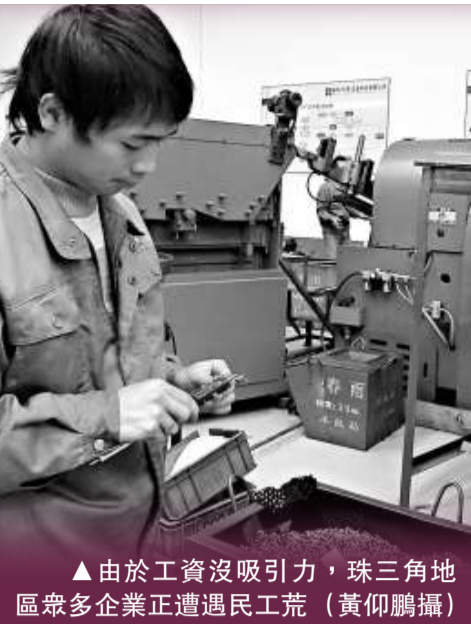
▲由於工資沒吸引力，珠三角地區眾多企業正遭遇民工荒