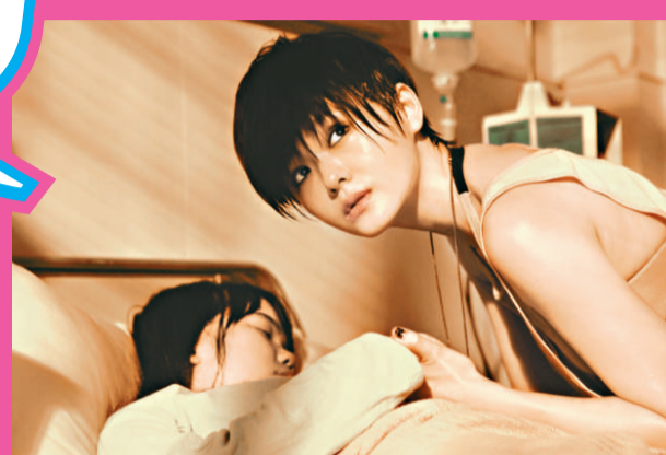
▲大S在片中為了患病小女孩而下海 ▼大S狠心剪短髮演機車女