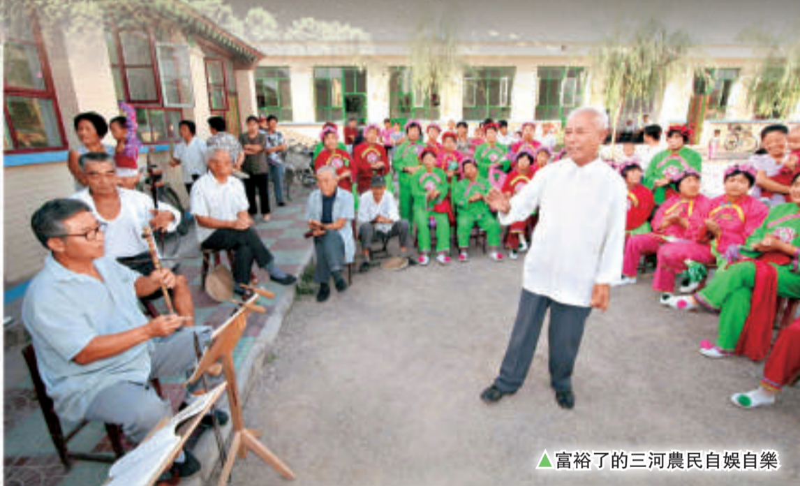
▲富裕了的三河農民自娛自樂

圍繞畜牧、蔬菜、花木三大主導產業，三河培育和發展了一批具有區域特色的名特優農產品生產基地，基本形成了「東北部的果、西部的菜、南部的糧、中部的花卉和苗圃」的種植布局和以「龍頭為核心、輻射周邊發展」的養殖布局，並探索發展了「合作社+基地+農戶」、「村委會+合作社+農戶」、「公司+合作社+基地」等專業合作社形式，全市共發展農民專業合作社42個、農業行業協會4個。入社（會）成員849人，入股資金4118.8萬元，聯繫帶動農戶2734戶。