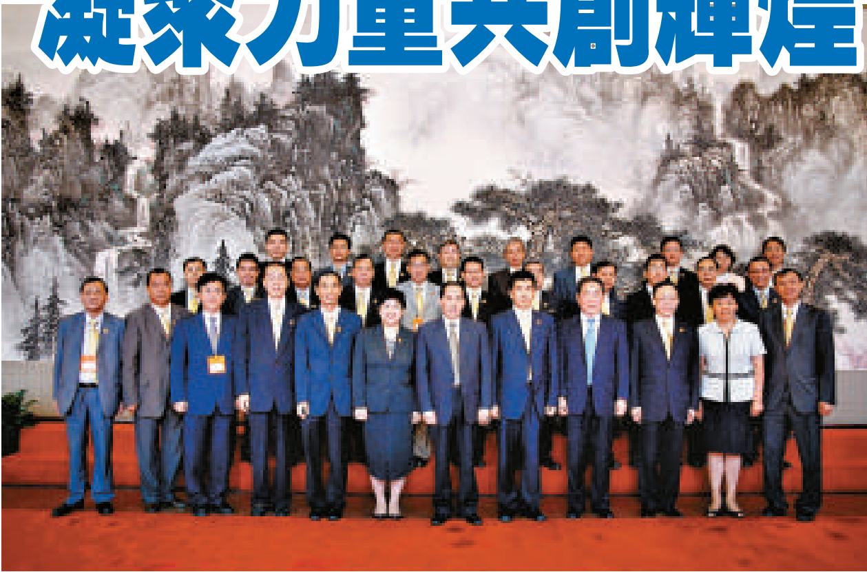
▲全國政協副主席李兆焯（前排右六）在京會見訪問團並與團員合照 ►婦委會訪京團成員大合照 ▲譚錦球會長（前排中）與廣西農墾局簽訂招商引資合作推廣協議