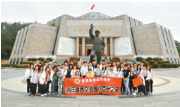
▲青年廣西交流團團員對百色革命老區留下深刻印象 ►總會於廣西活動期間宴請廣西壯族自治區黨委書記郭聲現（右二）及多位領導

為以身作則，譚會長於同年十一月出席中國東盟博覽會期間，與廣西自治區農墾局簽訂招商引資合作框架協議書，協助農墾局進行推廣宣傳，提高該局在香港，珠江三角洲及海外的知名度，促進廣西地區的經貿發展，為廣西