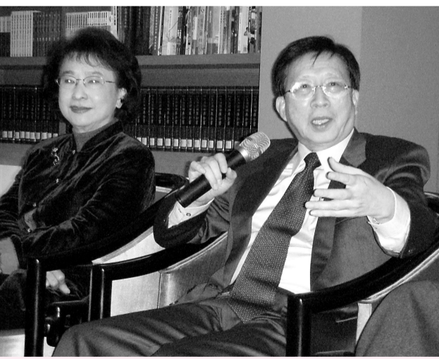
前「行政院長」劉兆玄（右）昨日接任文化總會會長，並與副會長林澄枝（左）暢談未來工作計劃

對於未來是否有訪問大陸的計劃，劉兆玄則說，現階段需要更熟悉會務，因此暫時沒有規劃，不過也不排除未來有這個必要性。