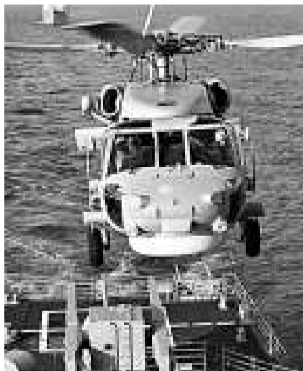
幾乎每一個美國總統上任後，都要對台售武一次。圖為海軍用美式裝備的直升機與基德級驅逐艦協同演練（資料圖片）

有分析說，台海博弈是一場「政治鬥爭」，所以美台軍售的政治意義更濃。在中國還未足夠強大之時，美國「以台制華」的戰略及台灣「以武拒統」的方針短期內是不會改變的，因此美台軍售的推動力量將繼續存在，美台軍售丑劇依舊會不斷上演，它仍將是密切美台關係的重要紐帶和影響中美關係的重要障礙。所以，不斷提升綜合國力與國際地位，才是中國在台海博弈中獲取主動的根本基礎。