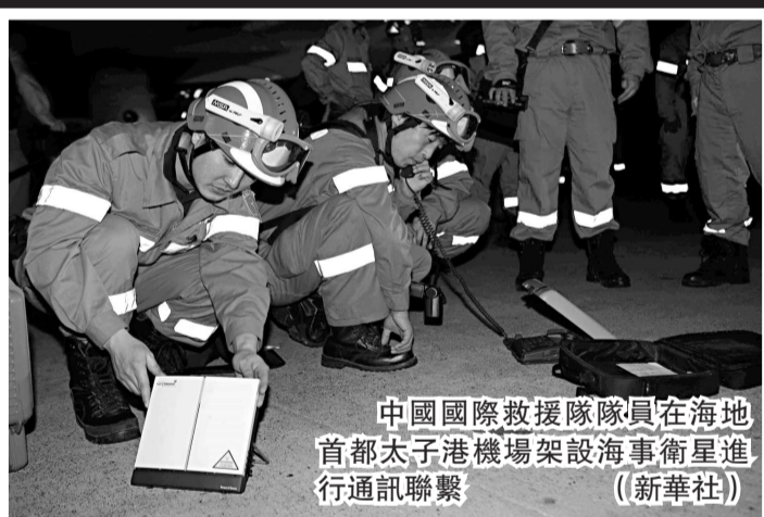
中國國際救援隊隊員在海地首都太子港機場架設海軍衛星進行通訊聯繫