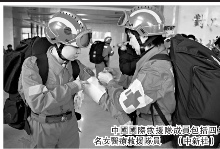
中國國際救援隊成員包括四名女醫療救援隊員

「壹基金」有關人士表示，地震等自然災害是全人類共同面臨的災難，全球「壹家人」理應不分國界，互幫互助。汶川地震時，國際社會紛紛對四川災區伸出援手，向災區和受災民眾提供了各種國際人道主義救援。此刻，面對同樣遭受強震突襲的海地，「壹基金」呼籲更多人關注災區情況，並為受災的地區和人民提供更多幫助。