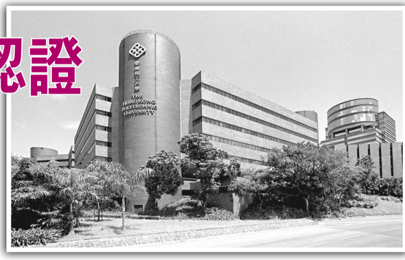
香港理工大學工商管理學院獲得AACSB認證是教育機構及商學院的重大成就

根據美國達拉斯市德克薩斯大學的百大商學院排名榜，理大商學院位列全球第六十六位，亞洲第三位。排名以各學院教員於二零零四至二零零八年間在二十四份主要學術期刊發表的研究論文為基礎計算，其中包括各商學院的三至四份首要期刊。 在金融及經濟研究方面，理大名列全球第四十二位。有關的研究結果載於二零零九年九月號的Journal of Financial Economics。排名榜根據於一九七零至二零零一年間進行的十一項研究數據計算出平均數，排名使用了該十一項研究中全部三十六份經濟學期刊以及五份主要金融學期刊相關的數字。理大是亞洲及澳洲區內唯一位列全球首五十名的大學。 AACSB成立於一九一六年，會員包括在七十四個國家及地區的一千二百所院校、企業及其他機構。該會亦為認證