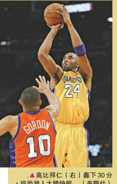
▲高比拜仁（右）轟下30分，協助湖人大勝快艇

【本報訊】據新華社華盛頓十五日消息：因持無照槍支被送上法庭的華盛頓巫師隊頭號球星艾利拿斯15日當庭服罪，這一重罪有可能從此斷送這位身價過億美元球星的NBA生涯。艾利拿斯目前尚不清楚自己是否會被投入監獄。3月26日哥倫比亞特區高等法院將對艾利拿斯一案進行宣判。