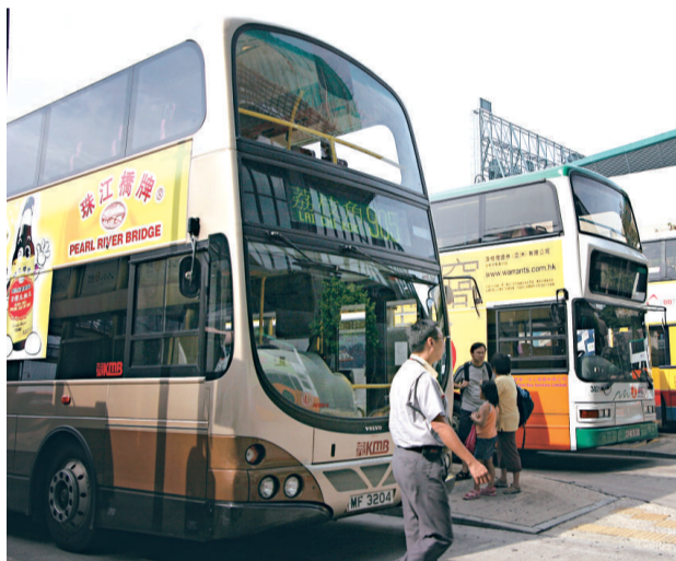
運輸署與環保署擬重組巴士路線，減少空氣污染

【本報訊】為改善本港空氣質素及紓緩交通擠塞，運輸署及環保署建議向專營巴士班次「開刀」，削減非繁忙時段載客率低於三成的巴士班次，並將一些未能提升使用率的巴士路線取消或合併。兩署將於本月底起，就有關計劃諮詢區議會。