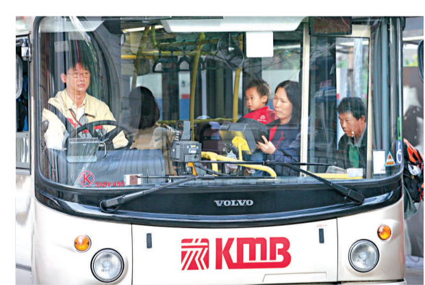
九巴司機超速問題近日有輕微改善

【本報訊】九巴自本月起增加使用雷射槍偵測巴士車速的次數，由每個月五次增至十二次，並會在將軍澳、沙田和北大嶼山等地抽查。九巴表示，旗下九成四的巴士已安裝了監測車速的黑盒；另外去年向運輸署申請延長十三條路線的行程時間，讓車長有更充裕的時間，其中十二條