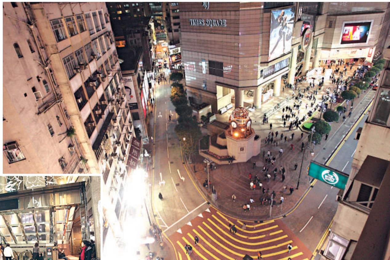
▲政府指勿地臣街(圖中左方通道)街道過於狹窄，不宜在地底興建隧道 ▲政府建議行人隧道「終點」設於時代廣場港鐵站出口

當局估計，兩項計劃的顧問研究將於未來數月內完成，並於今年年中進行詳細的技術可行性研究。之後將按既定程序，申請在工務計劃下設立所需的項目。