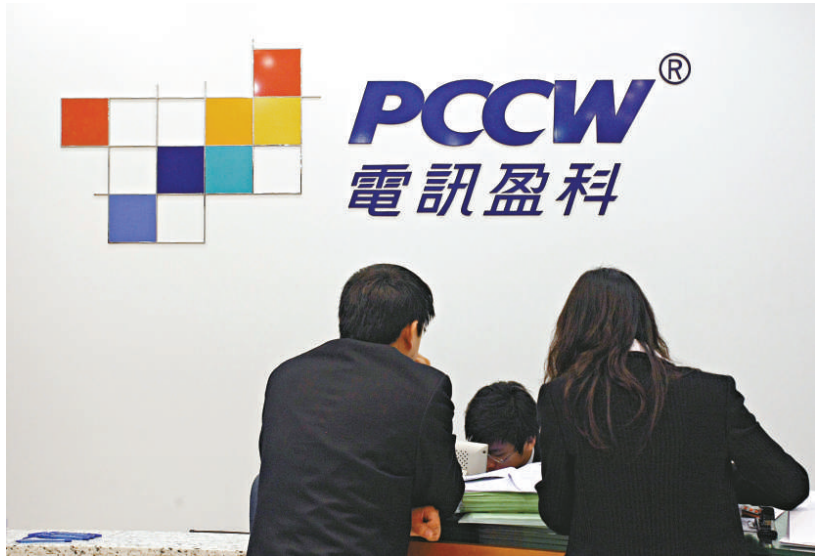
電盈將向港府申請免費電視牌照