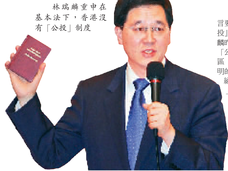
林瑞麟重申在基本法下，香港沒有「公投」制度

【本報訊】近日有反對派人士揚言要發動「五區「總辭」，變相『公投』」，政制及內地事務局局長林瑞麟昨日重申，在基本法下，香港沒有「公投」制度，反對派發起的所謂五區「公投」運動，並不符合基本法訂明的政制發展程序。他重申，不會接納有團體要求香港訂立「公投法」。