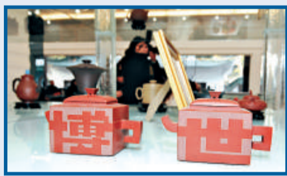
「2010 世博壺」以「上海」、「世博」四個漢字製成壺體，將筆畫延伸，自然形成流暢的壺把與壺嘴，堪稱一絕

據悉，比賽當晚，無論是媒體還是觀眾都要憑票進場，普通席 100 元，為媒體預留的 VIP 座位 150 元，開賽前 20 分鐘主辦方突然宣布取消活動。