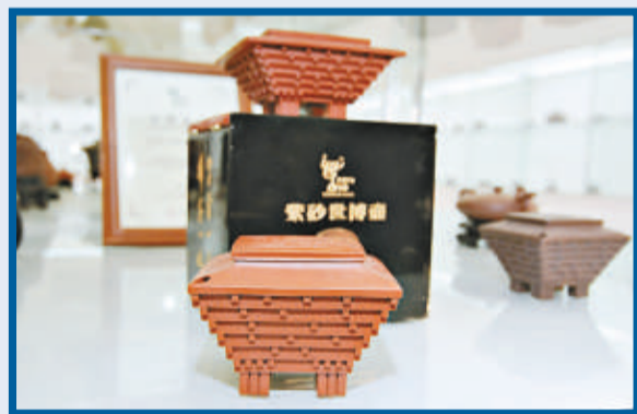
「東方之冠壺」以世博中國館為原型