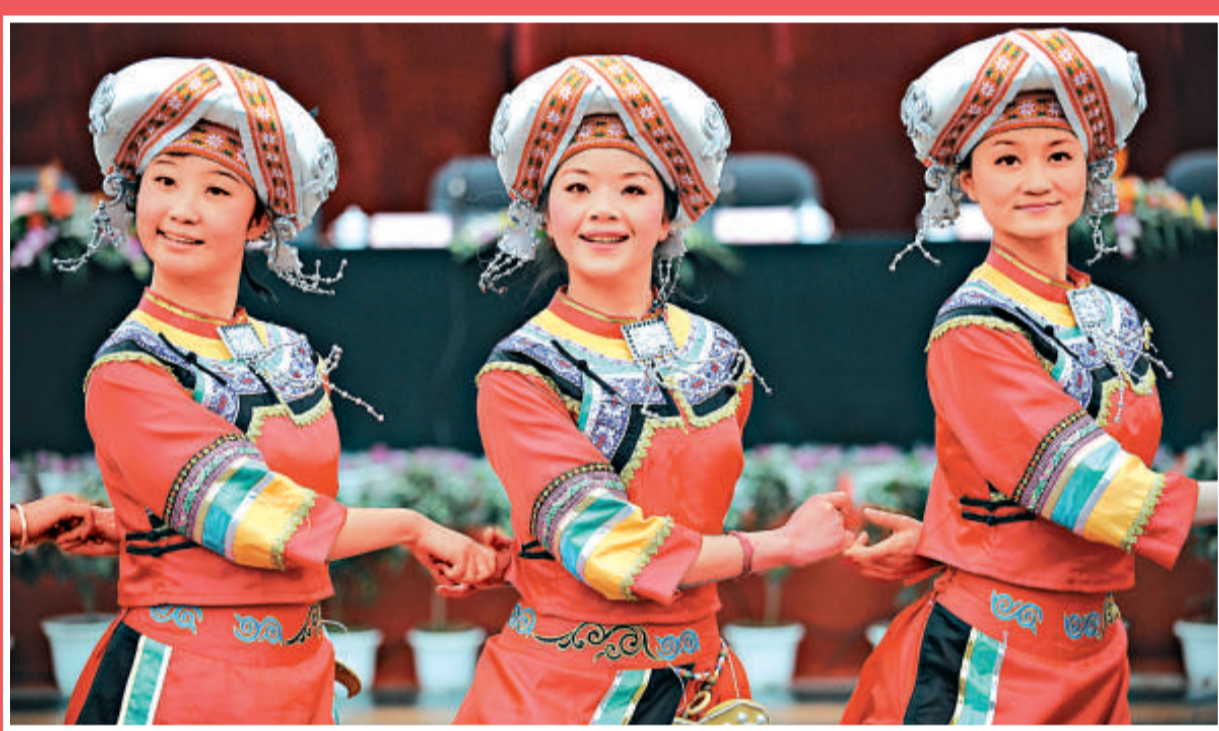
民運會進入倒計時 第九屆全國少數民族傳統體育運動會倒計時 600 天活動 18 日在貴州省貴陽市正式啓動。圖為身著少數民族服裝的演員在現場表演舞蹈。