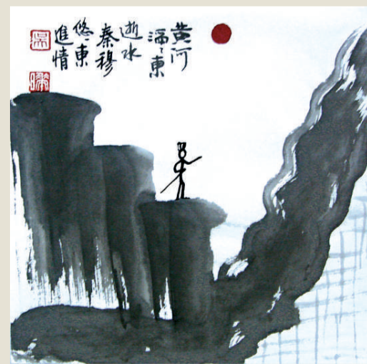
秦穆悠悠東進情（吳晔亮繪）

「作州兵」就是在承認土地私有基礎上，對兵役制度和軍賦制度進行配套改革。過去，晉國