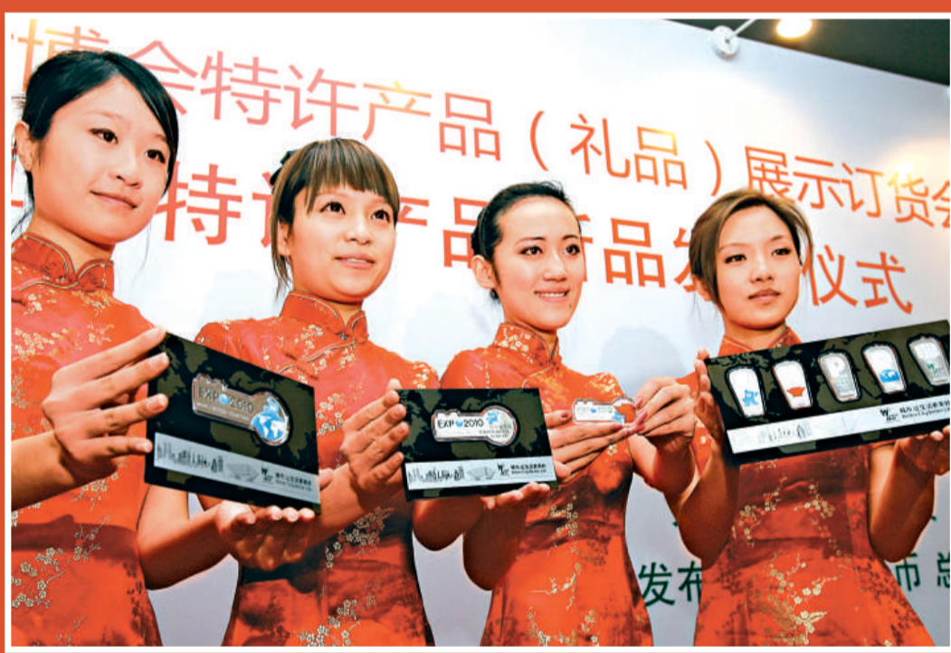
世博金銀條首發 由中國金幣總公司發行、上海金幣投資有限公司總經銷的中國2010年上海世博會彩色紀念金條及銀條系列產品，19日在上海首發。圖為模特展示系列產品。

此外，世博會期間國內各省區市舉辦宣傳周時，還將從當地選送約60名志願者加入現場服務；衆多外國展館也已在各自國內選拔志願者參與展館工作。世博會註冊志願者將分批接受統一的培訓。馬春雷說，上海市共設立了41個培訓基地，其中基層主要由高校和社區學校承接，網絡培訓平台也已構建完成。培訓內容分為通用培訓、專項培訓和崗位培訓，一共有14門課程。培訓方式上注重方便、高效和高質量，設計了包括網絡和書本自學、網絡授課和面授、模擬演練、崗位見習等多種形式，最終入選的志願者必須通過所有課程的考核才能上崗服務。