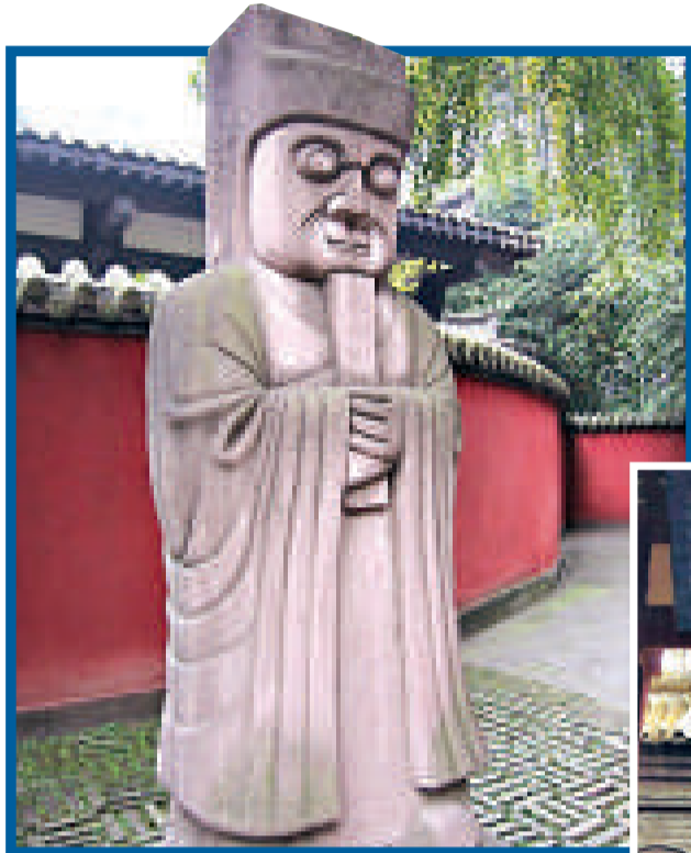
▲四川成都武侯祠內有「劉備墓」的石像 ▶武侯祠是紀念三國蜀國丞相諸葛亮的祠堂，祠內有「劉備墓」，墓前有「漢昭烈皇帝之陵」墓碑

【本報訊】《三國演義》中的劉備與曹操煮酒論英雄的經典故事，早已被歷史傳為佳話。社會科學院專家日前在對「真假曹操墓」定性之後，彭山人就有了這樣的觀念，「曹操都出來了，劉備還在彭山躺着好寂寞」；「應該挖出來，讓他重見天日和曹操煮酒論英雄」。