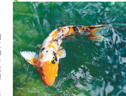
▲澳洲研究人員發現，魚的記憶力長達數月，還懂得詐騙

支持此一論點，還有悉尼大學魚類生物學家沃德。他認為，先前研究之所以說魚類記憶差，那是因為早期動物學家將人類作為參照標準；事實上，魚會透過欺騙或改變自身的行為來獲取食物。（綜合報道）