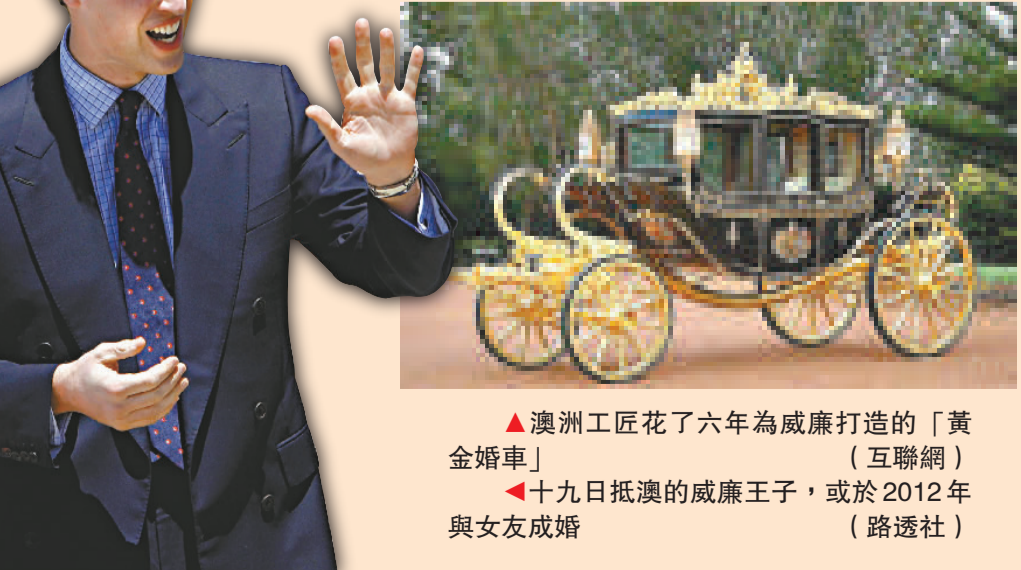
▲澳洲工匠花了六年為威廉打造的「黃金婚車」 ▲十九日抵澳的威廉王子，或於2012年與女友成婚

另外，英國威廉王子近日首次代表英女王伊利沙白官式出訪，展開為期五天的新西蘭和澳洲訪問行程。有傳他前往悉尼時，會首次與「黃金婚車」零距離接觸。威廉已於十九日抵達澳洲，上一次到訪澳洲是二十七年前，當時他還在襁褓之中。 據英國媒體發布的民調數據顯示，多數澳洲人更希望威廉王子繼任英國國王，而不喜歡他的父親查爾斯繼位。