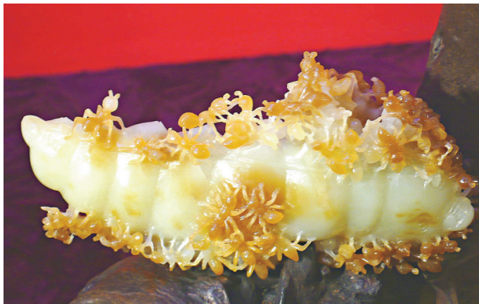
▲《小螞蟥》工藝精巧細緻