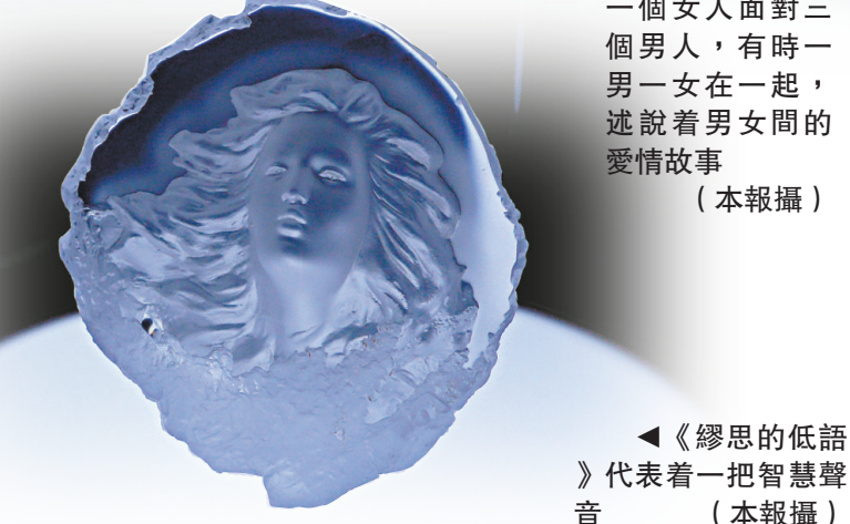
◀《繆思的低語》代表着一把智慧聲音