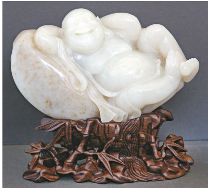
▲《籽玉佛》雕製了二十多年，身價暴升