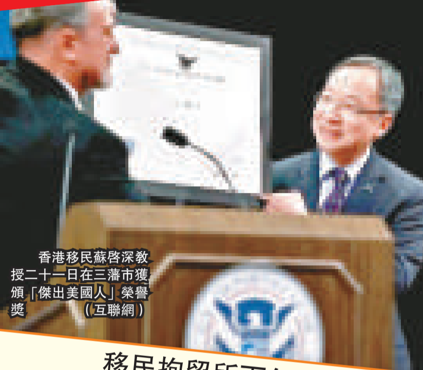
香港移民蘇啓深教授二十一日在三藩市獲頒「傑出美國人」榮譽獎

「傑出美國人獎」創立於二〇〇六年，旨在表揚對美國有特別貢獻及已入籍的移民。獲獎人士必需要在專業、商業、文化藝術、社會貢獻、政府服務或軍隊服役方面有傑出成就，並在成為公民後不遺餘力發揮所長惠澤人群。該獎自創立以來已有七十多人獲獎，當中只有五名華裔得主，包括前勞工部長趙小蘭。