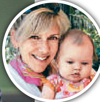
▲愛德華茲的情婦亨特和他們的私生女兒

【本報訊】綜合通訊社二十一日報導：二〇〇四年民主黨副總統候選人、二〇〇八年民主黨總統參選人愛德華茲二十一日公開承認，小女兒奎恩·亨特的確是他的私生女兒。