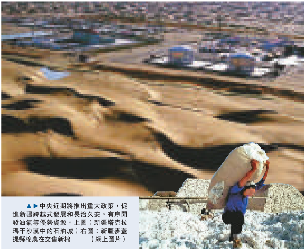
▲中央近期將推出重大政策，促進新疆跨越式發展和長治久安。有序開發油氣等優勢資源。上圖：新疆塔克拉玛干沙漠中的石油城；右圖：新疆麥蓋提縣棉農在交售新棉（網上圖片）

1月22日，新疆召開自治區招商引資工作會議，新疆黨委常委宋愛榮在會上發言指出，「今年中央還將召開新疆工作座談會，專題研究部署新疆工作，屆時將陸續出台一系列支持新疆經濟發展和穩定的重大政策。」這是中國官員首次公開透露有關新疆工作座談會的信息。