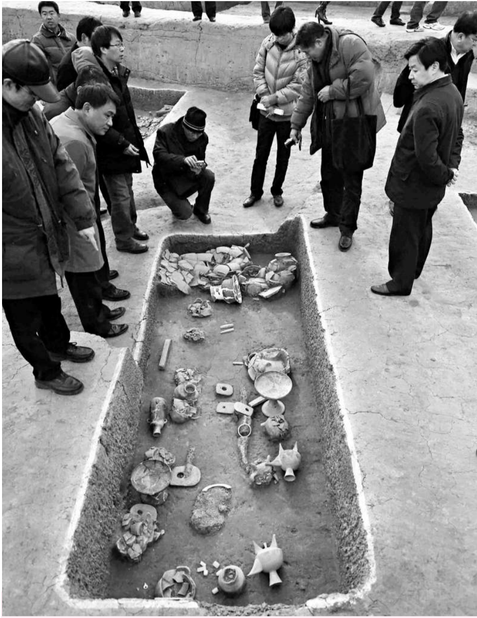
專家們23日在東山村遺址發掘的崧澤文化早中期墓葬前考察

據悉，下一步將在該處建設大型遺址公園和東山村遺址博物館，在保護的基礎上對其進行展示。