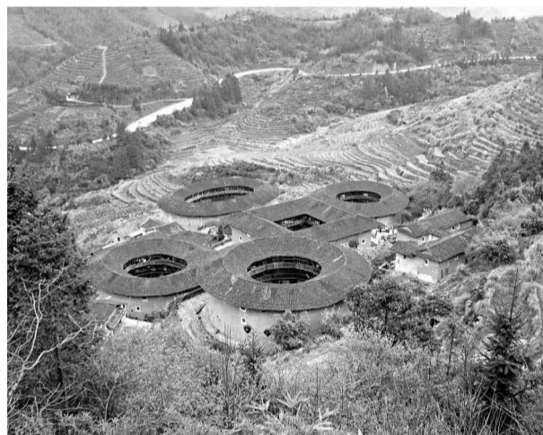
被旅遊界俗稱為「四餅一湯」（四圓一方）的南靖縣田螺坑土樓群

【本報記者陳仁水福州二十三日電】世界文化遺產「福建土樓」的主要分布地漳州和龍岩日前在福州聯合簽署協議，成立福建土樓旅遊發展聯盟，加強兩市三縣的協作，統一打造福建土樓旅遊品牌，共同推進土樓旅遊協同發展。