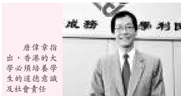
唐偉章指出，香港的大學必須培養學生的道德意識及社會責任

【本報訊】香港理工大學校長唐偉章昨日在電台節目表示，對於最近鬧得熱烘烘的「八十後」，市民必須包容忍耐，讓他們抒發意見和情緒，同時，要培養他們通曉兩文三語、具備國際視野、良好的情緒智商，最終成爲一個「講求實效的夢想家」。