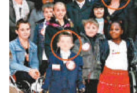
狠心母親（後排右一）長期虐待親生子（前排左二）

她又為兒子偽造一份長長的病歷表，伴稱兒子患了糖尿病、食物過敏、中樞神經系統癱瘓、囊性纖維化、吞嚥困難症等。