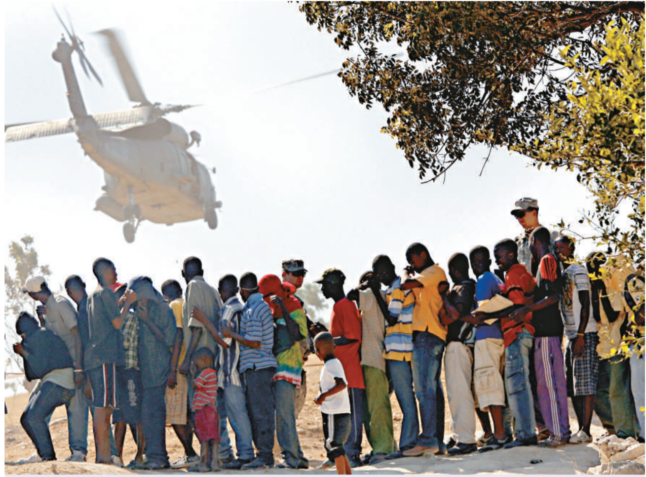
數千名災民在太子港等待分發救濟物資

聯合國糧食組織估計，逃往貧窮鄉村地區的人數可能「高達一百萬」。據悉，民眾陸續抵達中部的聖馬克及昂薩加萊地區，還有西部的戈納夫島，當中不少人都受了傷。