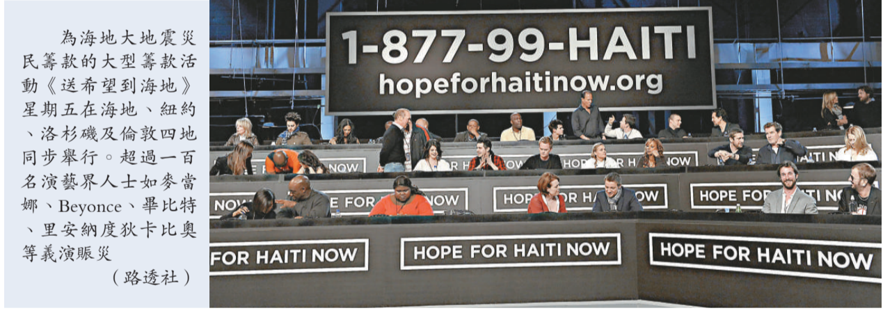
為海地大地震災民籌款的大型籌款活動《送希望到海地》星期五在海地、紐約、洛杉磯及倫敦四地同步舉行。超過一百名演藝界人士如麥當娜、Beyonce、畢比特、里安納度狄卡比奧等義演賑災

中國方面接受聯合國任務後，迅速啟動對外人道主義緊急援助應急機制，從解放軍總部機關、南京軍區總醫院、軍事醫學科學院、第二軍醫大學、第三零二醫院等抽調人員組成醫療防疫救護隊。救護隊人員具有參加聯合國維和行動、汶川地震救援的經驗，隨行攜帶了野戰衛生裝備和各類必要藥品，其主要任務是組織現場應急醫療救援，開展醫療巡診、衛生防疫等。