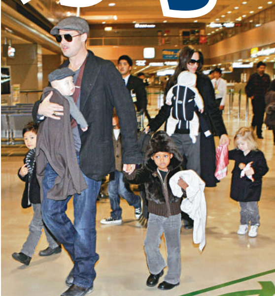
▲二人及六名子女曾經其樂融融

，他們早在去年底就開始諮詢離婚律師；至今年一月雙方共同簽署這份協議分手及均分財產的法律文件，但不確定這份文件何時開始生效，預計他們很快會對外公開分手消息。