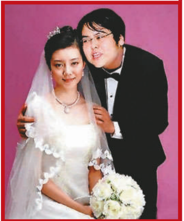
▲車曉和山西首富李兆會的婚紗照，在網上廣為流傳

「海倉慈善基金會」並擔任基金會主席。據記者從有關部門得到的數據，海倉集團和李兆會本人在公益事業方面捐款累計逾二億元。