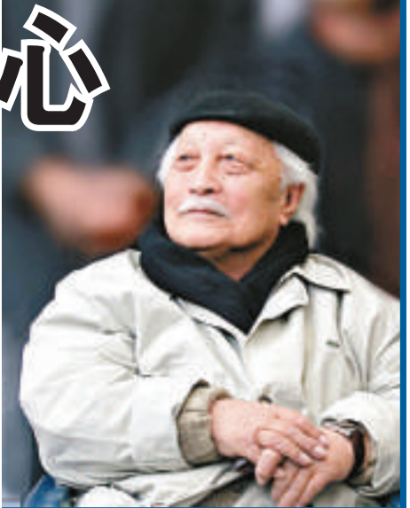
▲張汀被譽為是清華大學的「校寶」(網絡圖片)

作為中國現代美術教育體系開創者的張汀，參與籌建中央美術學院，組建中央工藝美術學院，為中國美術留下了一份至為珍貴的教育遺產。他在教學中，倡導中國畫的寫生，把民間藝術引進高校課堂，重視對世界先進文化的兼收並蓄，形成一種植根民族土壤、充滿生機銳氣的大美術學派和精神。